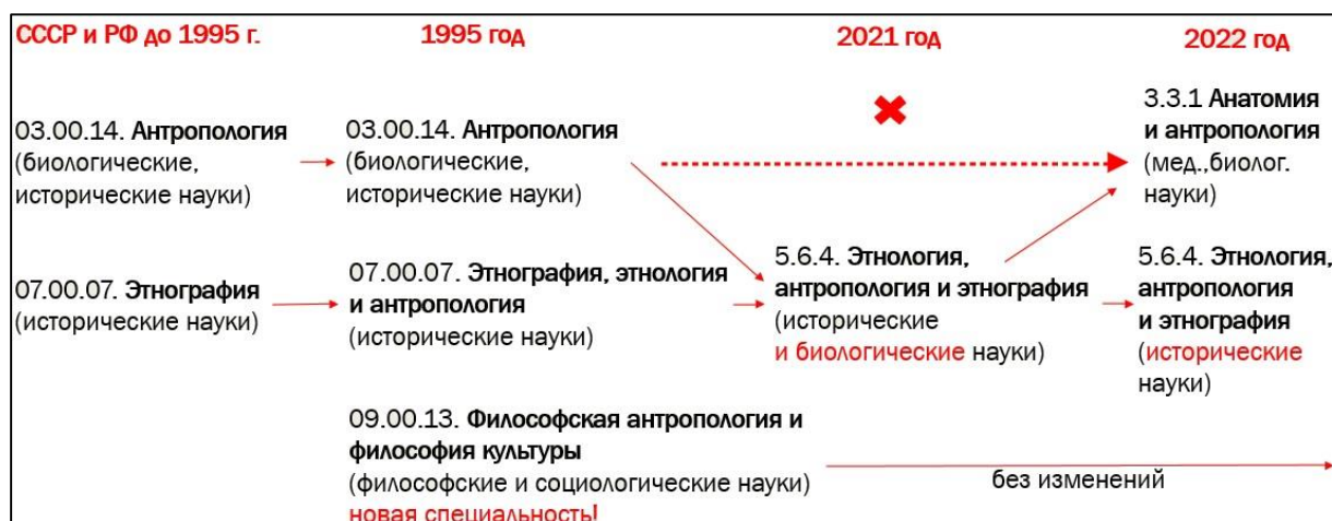
Рис. Антропология в отечественной номенклатуре научных специальностей

Нахождение биоантропологии в лоне биологии и ее возможности в разрешении вопросов исторического и биологического характера определяет ее некое пограничье в номенклатуре научных специальностей (рис.).