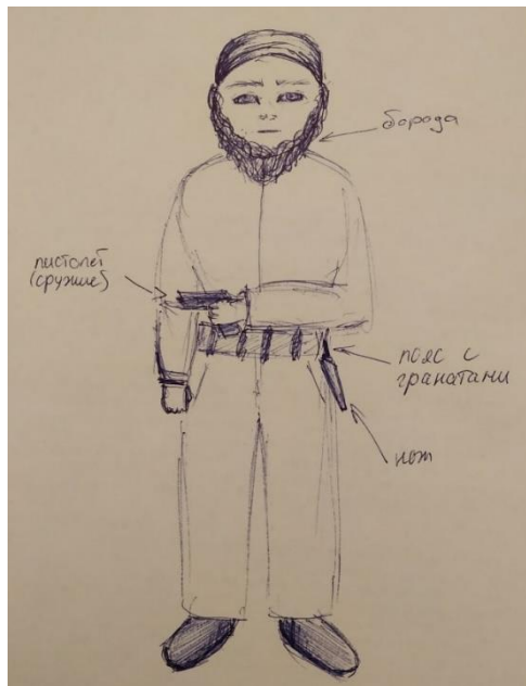
Рис. 1. Террорист глазами семиклассника

«Исламофобия» – термин, который используется в западных обществах, несмотря на отсутствие согласованного определения относительно его значения. Он вызывает много споров. Многие сомневаются в его правомерности либо просто отвергают его существование. Этот неологизм был создан в 1990-х гг. [19] для обозначения глобальных представлений об исламе в негативных, уничижительных смыслах и дискриминации в отношении мусульман по причинам социально-политической ненависти и предрассудков. Между тем понятие «исламофобия» прочно утвердилось в словаре многих теорий и концепций, изучающих проблемы межкультурного взаимодействия.